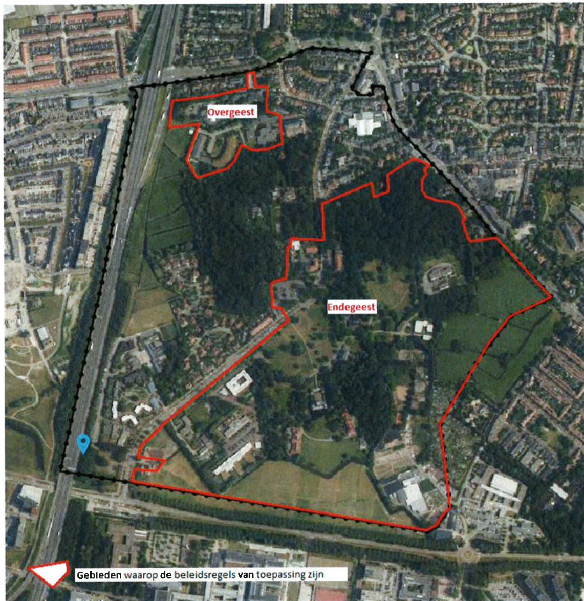
Kaart behorende bij beleidsregels 'Afwijkingsbevoegdheid kruimelgevallen Endegeest en Overgeest'